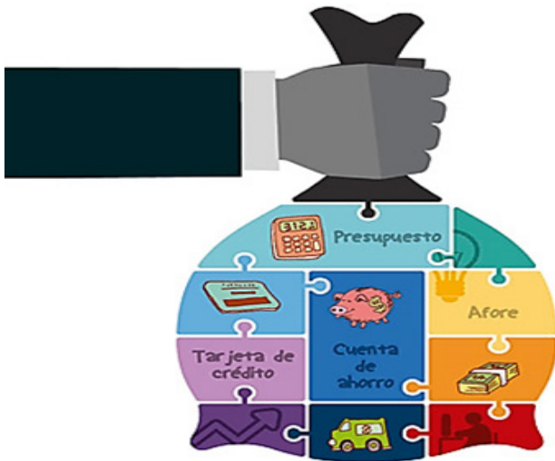
Figura 1. (Joven, 2012)