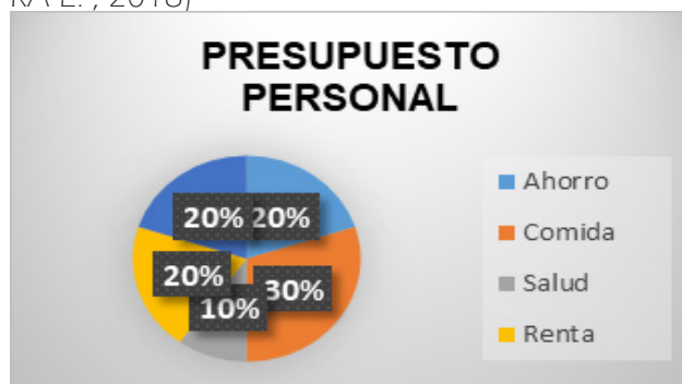
Figura 2. (Finanzas Personales, 2017)

“Para una correcta administración de las finanzas personales, los individuos/familias deben desarrollar primero una planificación financiera, para así saber cómo llevar a cabo la planificación de una inversión sobre la que decidir sus inversiones presentes y futuras” (FINANCIERA E. , 2018)