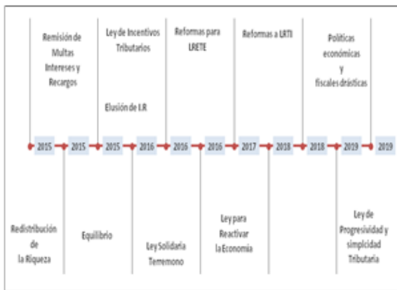
Políticas fiscales de Ecuador 2015-2019

Todos los acuerdos y disposiciones emitidas han sido dictaminadas con el afán de mejorar el nivel económico del país dando a conocer a través de la promulgación de beneficios por parte del sistema tributario nacional, de esta manera el nivel de emprendimientos y unidades de negocios aumente, generando así de forma directa tasas de empleo, generación de bienes y servicios que a su vez son demandados provocando el hecho generador causante de la aplicación de tributos directos e indirectos que más tarde serán utilizados como fuentes de ingreso para cubrir los proyectos económicos y los gastos que generen los organismos públicos en general.