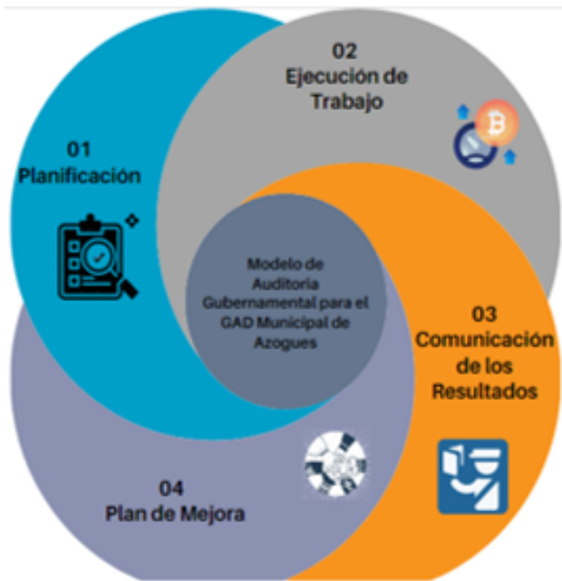
Figura 2. Modelo de Auditoría Gubernamental con énfasis en la gestión administrativa y ejecución presupuestaria.

Fase 1: Planificación: la fase de la planificación consta de los siguientes pasos: la planificación preliminar y la planificación específica, y una vez evaluado el control interno se continua con un paso adicional que es la determinación de los hallazgos a este nivel.