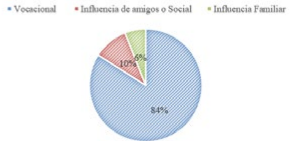
Gráfico 2 Modalidad adecuada para la carrera de Trabajo Social.

Nota: descripción sobre la modalidad y su proceso de aplicación en la selección del estudiante.