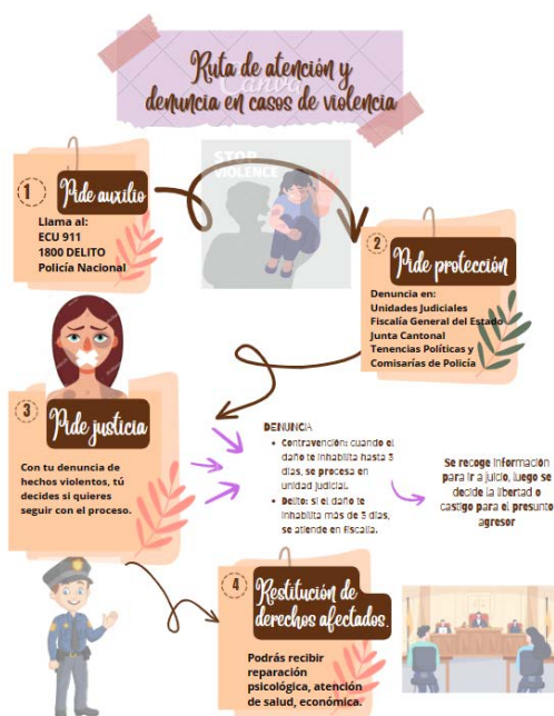
Figura 2 Vía para obtener medidas de protección frente a la violencia del núcleo familiar en el sistema judicial

Con respecto a este punto en la siguiente figura se observa el procedimiento de protección y atención en situaciones de violencia contra la familia en el sistema judicial.