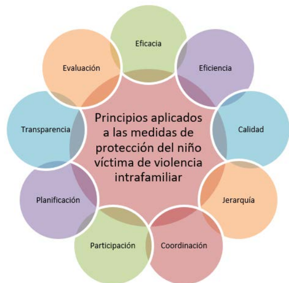
Figura 3 Principios de la Administración Pública aplicados a las medidas de protección del niño víctima de violencia intrafamiliar

Tal y como se aprecia en la figura anterior, en los casos de protección de los niños víctimas de violencia intrafamiliar, el Estado por medio de sus instituciones y en cumplimiento de los principios constitucionales, debe asegurar que las aludidas disposiciones sean acatadas