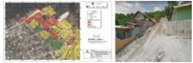
Mapa de deslizamiento del sector Briones

Nota. Plan Local de Gestión de Riesgo del Cantón Portoviejo (2018). Los colores del mapa equivalen, a rojo en alto riesgo, amarillo en riesgo medio y verde en nivel bajo.