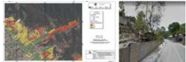
Mapa del barrio Los Altares en la parroquia Andrés de Vera

Nota. Plan Local de Gestión de Riesgo del Cantón Portoviejo (2018). Los colores del mapa equivalen, a rojo en alto riesgo, amarillo en riesgo medio y verde en nivel bajo.