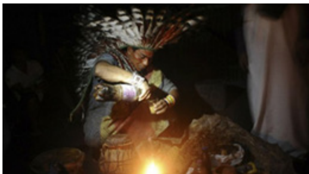
Ilustración 3: Shamán realizando rito con Ayahuasca

mental a largo plazo derivados del consumo crónico de ayahuasca. En un primer estudio administramos pruebas de personalidad, salud general, funciones neuropsicológicas, bienestar psicosocial, propósito vital y espiritualidad a un grupo de 60 daimistas y lo comparamos con 60 controles de una comunidad cercana (Boca do Acre). Estas mismas pruebas se administraron ocho meses después de cara a valorar la estabilidad de los resultados. En Río Branco repetimos el mismo proceso para evaluar la fiabilidad de los datos encontrados en Mapiá, aunque a fecha de hoy solamente disponemos de los resultados de una primera evaluación. Se realizó una segunda evaluación un año después de la primera y se llevará a cabo una tercera evaluación un año después de la segunda, de nuevo, para valorar la estabilidad de las puntuaciones. Algunos de los resultados encontrados en estos estudios se presentarán en este capítulo.