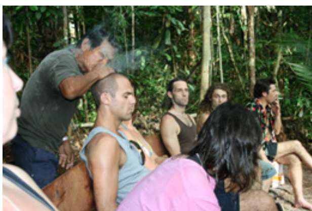
Ilustración 6: Uso de la ayahuasca en ceremonia de sanación Ecuador

La Ayahuasca es una medicina con tradición milenaria y tiene que ser aplicada usando las técnicas comprobadas y usadas por milenios. Es un remedio y como cada remedio tiene que ser servido en cantidades y la frecuencia adecuada e indicada por un especialista. Usándolo en cantidades grandes puede convertirse en un veneno con efectos negativos en los participantes.