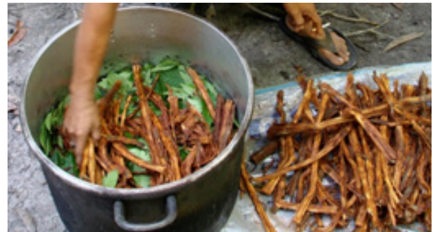
Ilustración 5: Preparación de la infusión de la ayahuasca

El primero registro de contacto occidental con la ayahuasca data de 1851, por Richard Spruce,.