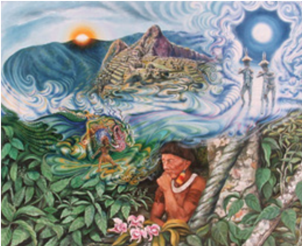
Ilustración 1: Idealización de los efectos de la ayahuasca en el curandero

de bienvenida se comparte la ayahuasca entre los presentes, de tal modo que los mismos tienen la oportunidad de vivir el proceso de transfiguración antes mencionado, donde afirman haber abandonado su cuerpo y conectado con un mundo espiritual, hay otros que afirman haber conocido presagios que siempre se cumplieron y por ello se le han atribuido todos los beneficios antes mencionados.