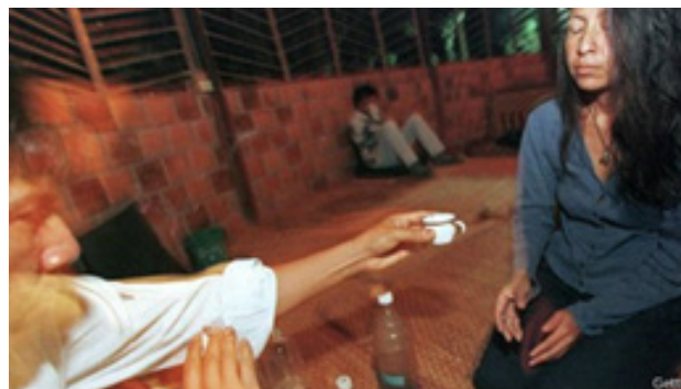
Ilustración 2: Ingesta de Ayahuasca en Perú

guínea, cambio en el pH, etc y con ello aumenta la sensibilidad auditiva, olfativa, de la visión y el tacto. En este nivel de capacidad paranormal, aflora espontáneamente despertando las neuronas, aumentando la capacidad intelectual y creativa. (Onirogenia, 2012, pág. 4)