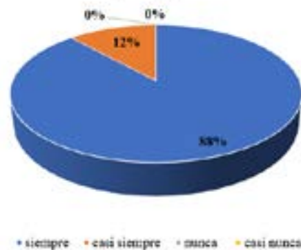
Concientización de los contribuyentes pago del impuesto predial

Interpretación: A cerca si existe concientización por parte de los contribuyentes con respecto a su responsabilidad de cancelar el impuesto predial, el 88% manifestó que siempre, mientras que el 12% dijo que casi siempre.