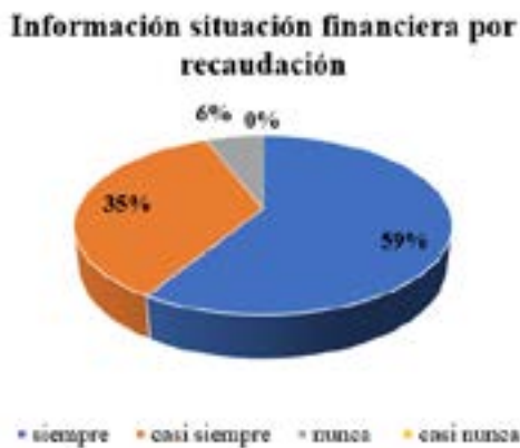
Figura 13 Información situación financiera por recaudación

Interpretación: En el aspecto referente a si el GAD da a conocer la situación financiera del GAD a sus contribuyentes, el 59% indicó que siempre, el 35% que casi siempre y el 6% dijo que nunca.