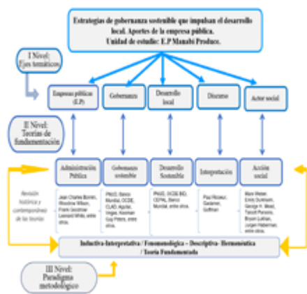
Figura 1 Descomposición del objeto de estudio

Nota: Modificado a partir de la propuesta original de Vegas-Meléndez (2015). Tesis doctoral