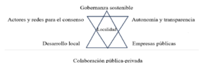
Figura 3 Gobernanza sostenible

Nota: Modificado a partir de la propuesta