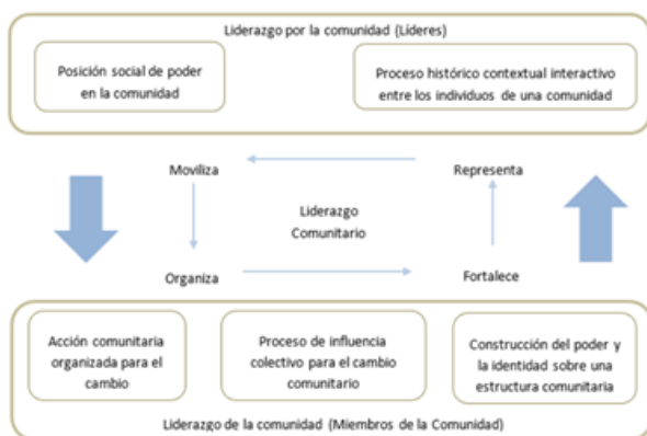
Dimensiones del liderazgo comunitario