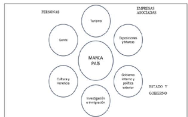
Hexágono de Anholt

Nota. La figura representa el hexágono de Anholt. Tomado de Anholt (2016).