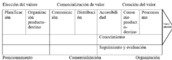
Cadena de valor del turismo

Nota. La figura representa la cadena de valor del turismo. Tomado de Pulido (2016).